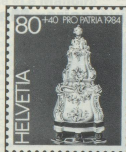
80 + 40 c. Museum Ariana, Genf Musée Ariana, Genève Museo Ariana, Ginevra