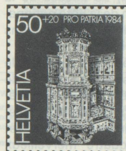
50 + 20 c. Freulerpalast, Näfels Palais Freuler, Näfels Palazzo (Freuler), Näfels