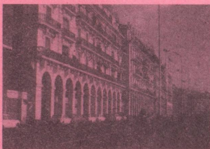
Ambassade 27, bd Zirout Youcef B.P. 482 Tél. : 63.39.02, 63.83.12, 64.65.91 ALGER GARE de 9 h à 12 h du dimanche au jeudi