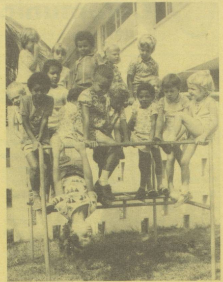
Ecole suisse à Accra.

C.Z. A titre personnel, je relèverai que la loi actuelle a été conçue avec beaucoup d'enthousiasme et d'engagement, mais qu'elle n'a pas assez pris en considération deux éléments fort importants: l'absence de véritables compétences fédérales en matière scolaire et les implications financières, notamment au niveau des salaires. Il en est résulté passablement de mécontentement, alors même que la Confédération - cas unique en cette période de coupes sombres dans les subventions - n'a aucunement réduit ses versements obligatoires; elle s'est contentée de renoncer à certaines prestations que la loi prévoyait à titre facultatif. N'oublions pas que la Con-