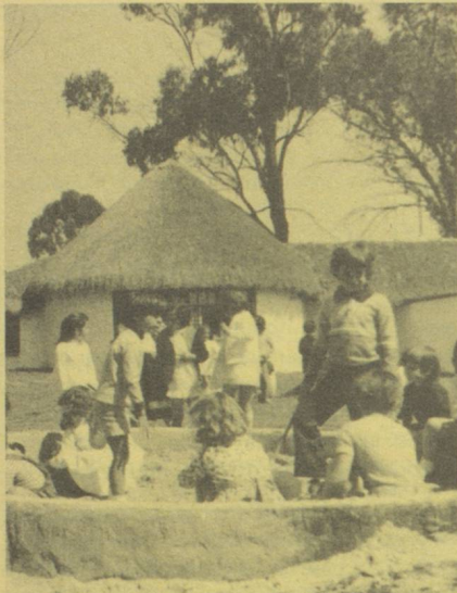
Ecole suisse à Bogota.

C.Z. L'âge d'admission aux études universitaires est de 18 ans. Pour être immatriculé, il faut avoir obtenu le diplôme suisse de maturité ou un certificat étranger équivalent; la reconnaissance de ces derniers relève de la compétence particulière de chaque université; celui qui désire savoir si son certificat d'études secondaires sera reconnu doit écrire directement à l'université où il souhaite s'inscrire. Dans certains cas, il convient de passer des examens d'admission auxquels on peut se préparer lors des cours spéciaux organisés à Fribourg. L'Office central universitaire suisse (Sophienstrasse 2, CH-8032 Zurich) renseigne sur les conditions d'admission et les programmes d'études des différentes universités.