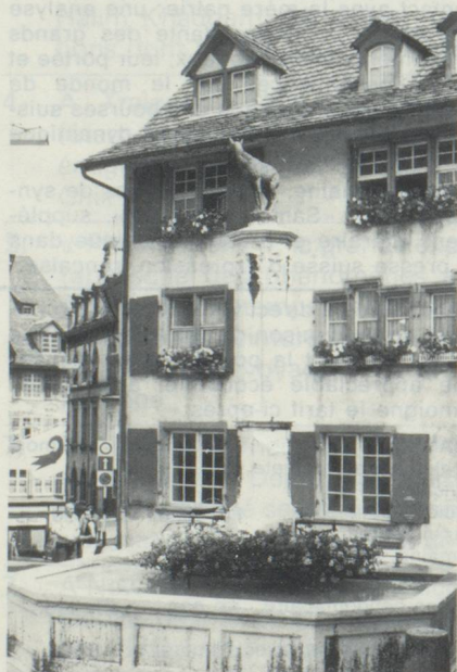
Bâle. La fontaine du chamois, l'un des attraits de la vieille ville.