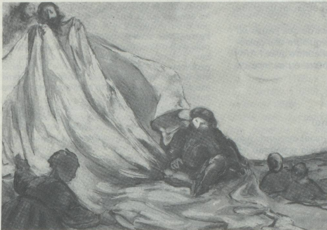
Henriette de Foras Huiles « Scènes de la vie quotidienne »

certainement d'un goût et de dons de l'artiste pour l'illustration ; on pourrait aisément se représenter des textes qui les inspirent et c'est peut-être la voie où ses qualités de composition trouveraient leur plus sûr aboutissement. Telles qu'elles sont ces petites huiles sont librement enlevées et les meilleures dans un style qui n'est pas sans rapport avec celui des peintres du dix-huitième italien.