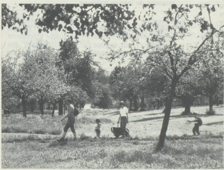
Promenades en famille dans la nature à la saison des arbres en fleur, une joie pour grands et petits. Notre photo : dans le canton de Thurgovie/Suisse orientale