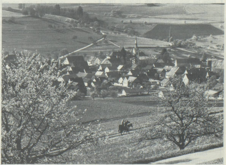
Schleitheim, dans le canton de Schaffhouse Le village viticole avec ses belles maisons à colombage est situé entre les hauteurs du Randen et la frontière.