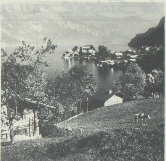
Loin du trafic, Iseltwald est une station tranquille du lac de Brienz/Oberland bernois