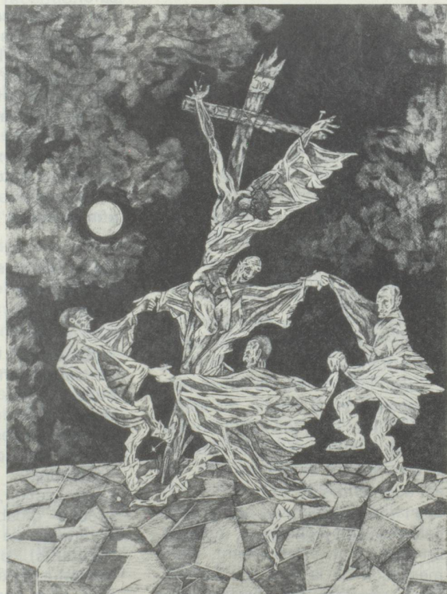
Crucifixion I 1939 - plume - 48 x 36 cm

« Dessiner d'après modèle me paraissait indigne. Pas question de copier la nature, d'apprendre à observer. J'estimais qu'un peintre devait tout maîtriser par son seul pouvoir de représentation. Ce que je dessinais ne pouvait prétendre à la moindre crédibilité anatomique ou biologique. Mais cela signifiait quelque chose ; c'était bien suffisant. Aujourd'hui encore, je dessine et je peins avec la même absence de scrupules. Lorsque je présentai à Varlin l'une de mes rares huiles, « La Catastrophe » (qui date de 1968), le grand peintre considéra la toile avec stupeur, et ne voulut pas vraiment croire ce qu'il voyait : sur un pont, au-dessus d'une gorge, deux trains bourrés de passagers se heurtent en pleine course ; tous deux jaillissent d'un tunnel, cherchant furieusement l'air libre, et trouvant leur perte ; ils se fracassent contre un autre pont, beaucoup plus bas, sur lequel défile une manifestation communiste ; si bien que les ponts, les trains, les passagers et les communistes s'écroulent sur une église de pèlerinage, tout au fond de la gorge, et dont les décombres ensevelissent d'innombrables pèlerins, tandis qu'en haut, bien au-dessus du gouffre, dans le bleu d'un ciel de printemps, le soleil se fracasse contre un autre soleil, inaugurant la destruction de la terre et de tout le système planétaire. Varlin se taisait. Finalement, d'une voix soucieuse, il formula cette opinion : « Un adulte ne devrait pas peindre des choses pareilles. »