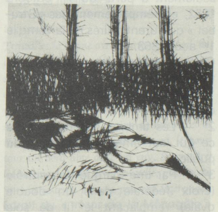
Editions L'Age d'Homme — Case postale 67 — 1000 Lausanne 9 Illustrations de Ivo Soldini

Ivo Soldini est un jeune artiste tessinois qui vit et travaille dans le Mendrisiotto. Habituellement sculpteur, il parvient à exprimer dans ses gravures d'autres traits d'un tempérament intensément créateur.