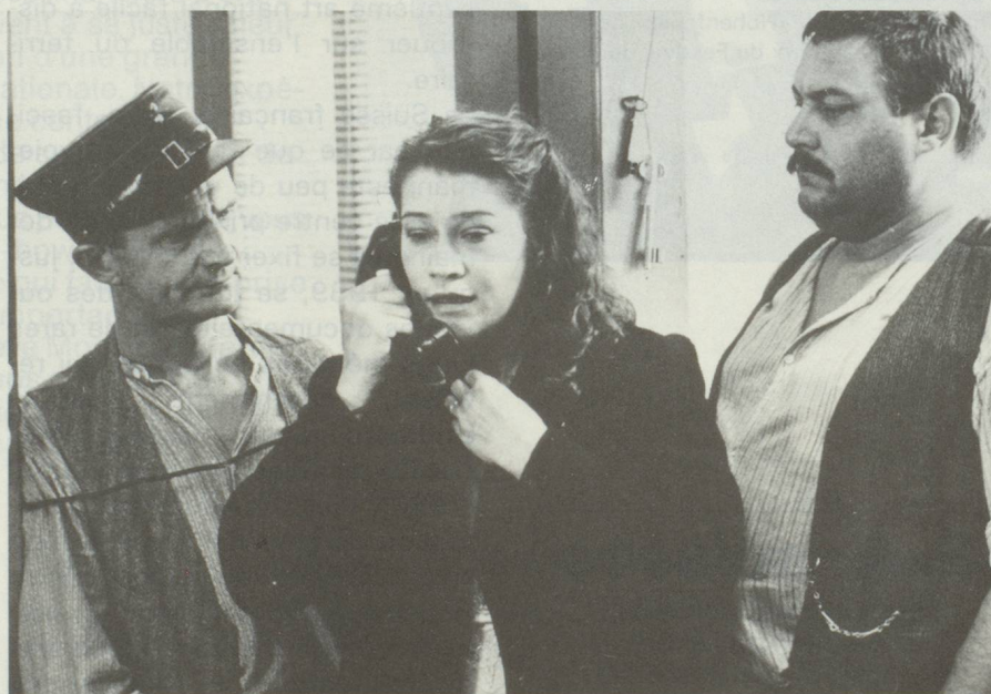
«Das Boot ist voll», 1980 ▼

vif, combatif, non dépourvu d'humour, dans un pays sans véritable tradition dans ce genre d'expression. Charles mort ou vif (1969) et La Salamandre (1971) d'Alain Tanner, Les arpenteurs (1972) de Michel Soutter, Le fou (1970) et