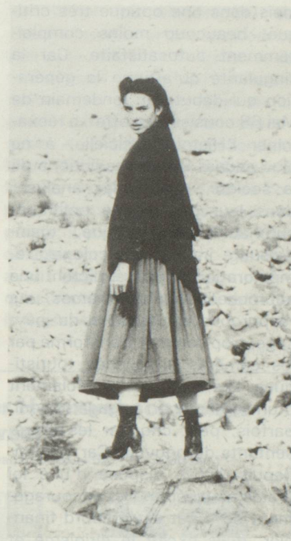
«Derborence», 1985

La Suisse française, alors, fascinée par ce que Paris lui envoie, manifeste peu de volonté créatrice et le centre principal en ce domaine va se fixer à Zurich où, jusqu'en 1939, se tournent des ouvrages documentaires et de rares longs métrages de fiction qui révèlent, notamment, Léopold Lindtberg avec Fusilier Wipf (1938) et Wachtmeister Studer (1939). Puis, brusquement, la situation du pays dans une Europe en guerre oblige au combat contre les idéologies totalitaires: en vertu des pleins pouvoirs le Conseil fédéral institue le Ciné-Journal suisse en 1940, actualités hebdomadaires de huit à dix minutes (dans les trois langues) figurant obligatoirement au programme de toutes les salles. En outre, la nécessité d'un renforcement de l'esprit confédéral stimule plusieurs cinéastes qui portent à l'écran des