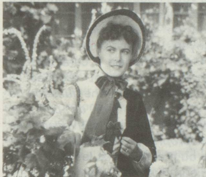
«Les petites fugues», 1978 ▼