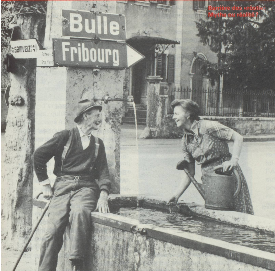
Barrière des «röstli» Mythe ou réalité?