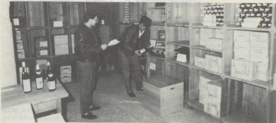
Voici une vue de cette cave fédérale de 7 m sur 7.