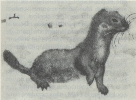
Belette, gravure de Robert Hainard.