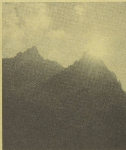
Photo des deux Mythen/SZ