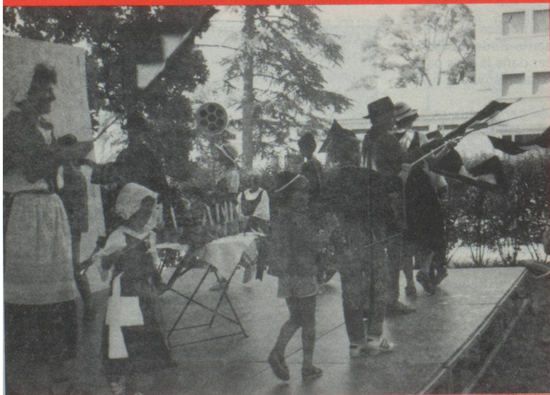
Farandole sous les applaudissements des spectateurs.