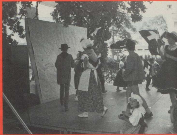
Querelles, réconciliations entre la France et la Bourgogne