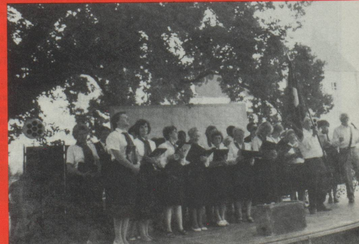
L'Union Chorale Suisse de Paris.