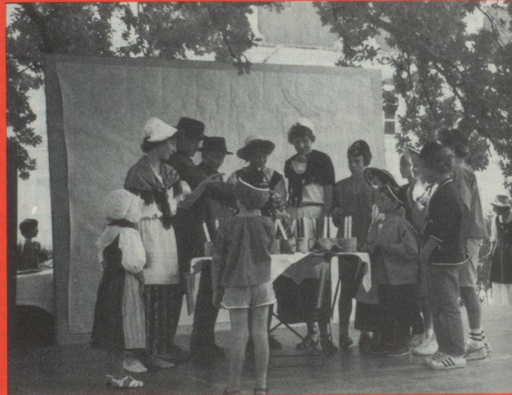
Le magnifique gâteau anniversaire