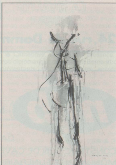
Prix Silvagni 1987 attribué à Henri Rouyer pour ce lavis reproduit ci-dessus.

était en réalité une première et un véritable évènement ; jusqu'ici en effet, seuls les artistes exportés de la terre natale y avaient droit d'asile et l'on ne saurait assez louer les initiatives qui ont abouti à cette issue ; la presse dissipa une légère amertume chez ceux qui ont choisi la voie difficile d'une carrière parisienne.