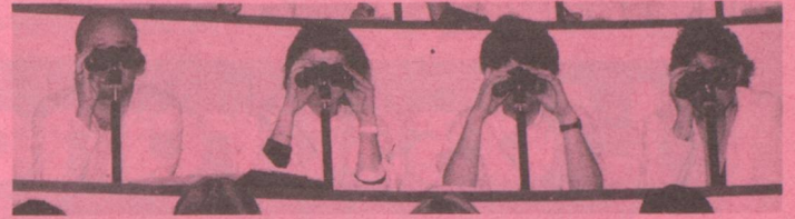
Pas seulement les futurs médecins devraient y regarder de plus près... (Des étudiants dans l'amphithéâtre de pathologie de l'Université de Berne; photo: Lisa Schäublin).

Ecoles privées en Suisse , liste des écoles qui font partie de l'Association des écoles privées,