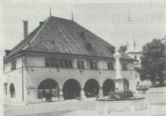
Hôtel des six communes, Môtiers (photo: J.-P. Mäder).

Le produit de la collecte 1987 en faveur de la protection du patrimoine servira à restaurer une trentaine de maisons à Môtiers, dans le Val-de-Travers. Le philosophe Jean-Jacques Rousseau a vécu plus de trois ans (1762-1765) dans ce petit village du Jura neuchâtelois, qui aujourd'hui encore semble sorti d'un livre d'images.