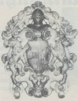
Armoiries espagnoles XVII e , bois polychrome