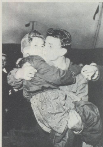
Les rapatriés retrouvent les leurs.

Mis sur pied il y a une trentaine d'années, le Service de recherches de la Croix-Rouge suisse traite bon an mal an plus de 200 demandes concernant des personnes disparues. Il répond en principe aux demandes de recherches de personnes à l'étranger, émanant de personnes domiciliées en Suisse et inversement effectuée des recherches en Suisse sur demande de personnes résidant à l'étranger. A ses débuts, le service n'avait que des demandes isolées à traiter. La première grande vague a coïncidé avec l'exode des Hongrois en 1956. Les familles recherchaient leurs membres dis-