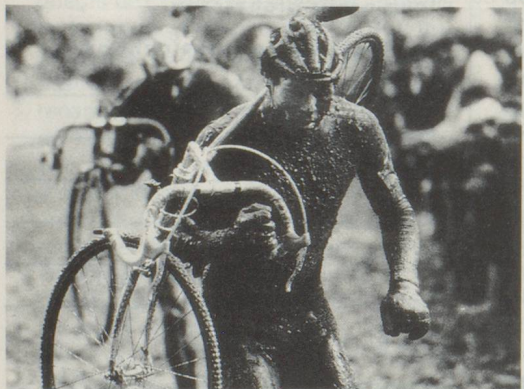
Pascal Richard, le roi suisse de la piste boueuse.