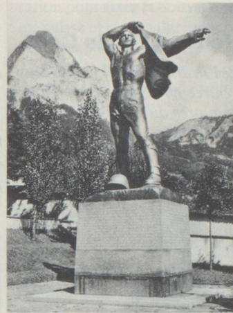
La Guerre (Monument aux défenseurs du pays, datant de 1941, à Schwyz)...

En septembre 1988, des étapes décisives devront être franchies: il est prévu qu'à la fin du mois, la presqu'île située dans la baie de Brunnen deviendra à titre définitif la propriété de la «Fondation Place des Suisses de l'étranger». Cependant, la récolte de fonds se poursuit; on espère arriver à 3 millions de francs suisses (1,5 million pour l'achat du terrain et 1,5 million pour l'aménagement de la place). La date limite pour la rédaction du présent numéro étant fixée très tôt, il ne nous est pas possible de