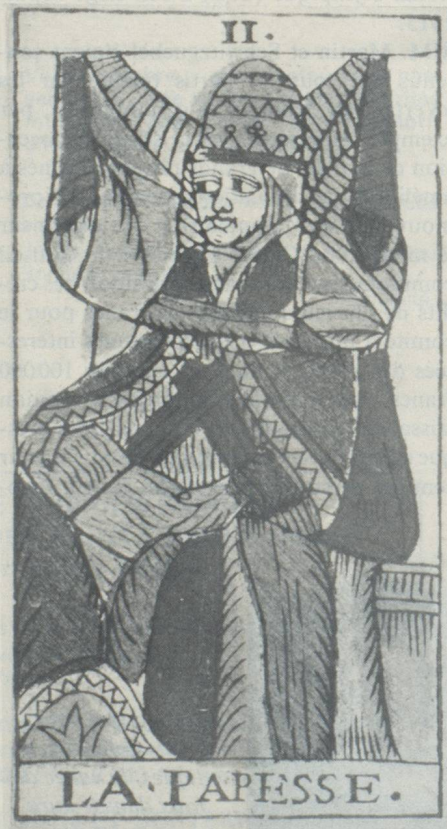
Carte d'un jeu de tarots datant de 1760 environ, représentant la papesse.

Les jeux de cartes du moyen âge ont un point commun avec ceux qui les ont remplacés aujourd'hui: ils sont divisés en quatre couleurs. Comme on le sait, nos jeux de yass ont conservé jusqu'à ce jour cette répartition. Les cartes allemandes ont leurs propres noms («Schilten, Schellen, Rosen, Eicheln»). Pour les cartes françaises, on parle de pique, carreau, cœur et trèfle. Ces quatre couleurs sont peut-être une survivance de la prédilection qu'avaient les anciens pour une