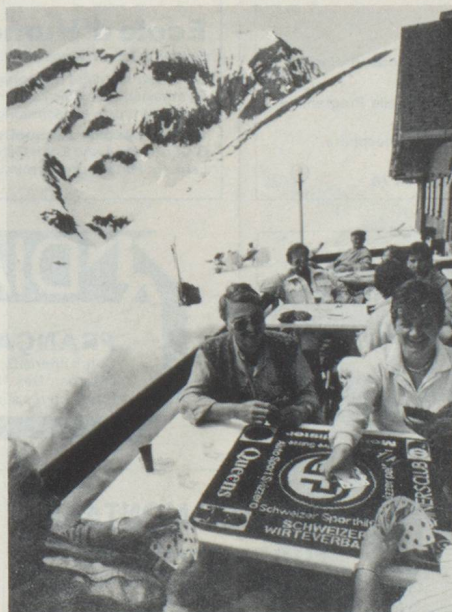
Yass de plein air à l'Engstligenalp dans l'Oberland bernois.

tions et concluaient des alliances «tous azimuts»; elles subirent par conséquent, dans le domaine des règles des jeux de cartes, des influences très variées. Ce n'est qu'au 19 e siècle qu'est né un Etat qui se fondait sur une économie en plein développement. Désormais, on avait besoin de ces jeunes gens dans les administrations et les usines. Très logiquement, on a donc édicté des règles de plus en plus sévères interdisant le service mi-