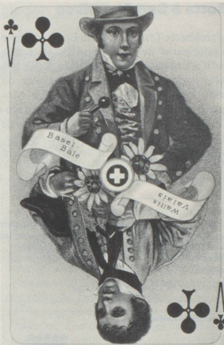
Le valet de trèfle, dans le jeu de cartes «La Suisse historique».

Après la fin du cauchemar qu'avaient été les révolutions et les guerres, l'Etat fédéral uni a été constitué avec une capitale fixe et le jeu du yass – typiquement suisse – s'est développé. Même s'il paraît s'agir là de deux choses bien différentes, il ne fait aucun doute qu'il y a eu entre elles une interaction assez importante. Auparavant, les diverses régions, qui n'étaient reliées entre elles que par des liens très lâches, avaient toutes une foule de particularités que l'on a de la peine à imaginer. Les diverses républiques, très conscientes de leur autonomie, établissaient des rela-