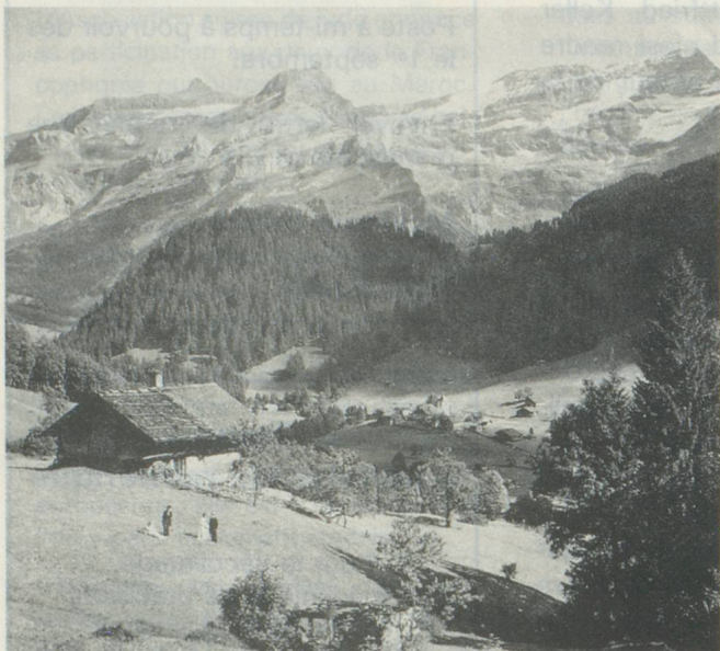
Vers-l'Eglise et le massif des Diablerets, vers 1900.

Cette contrée des Alpes Vaudoises commença à être parcourue et admirée par des visiteurs dès la fin du XVIII e siècle. Leur nombre augmenta rapidement avec l'ouverture d'une route carrossable depuis Aigle, dans la vallée du Rhône, en 1839 et la mise en service du Grand Hôtel des Diablerets, en 1856. Le 8 août 1888 fut créée la Société d'embellissement et d'utilité publique de la commune d'Ormont-Dessus, dont le chef lieu est Vers-l'Eglise.