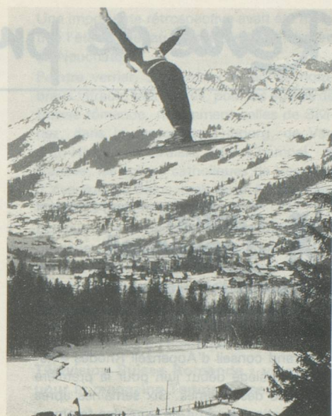
Saut à ski au concours national.

La première ascension réussie du massif des Diablerets eut lieu en 1850. La cabane des Diablerets fut construite en 1904 et le refuge de Pierredar quatre années plus tard. En juillet 1969 eurent lieu les premières « journées du film alpin Suisse », manifestation rebaptisée depuis 1970 « Festival international du film alpin des Diablerets ».