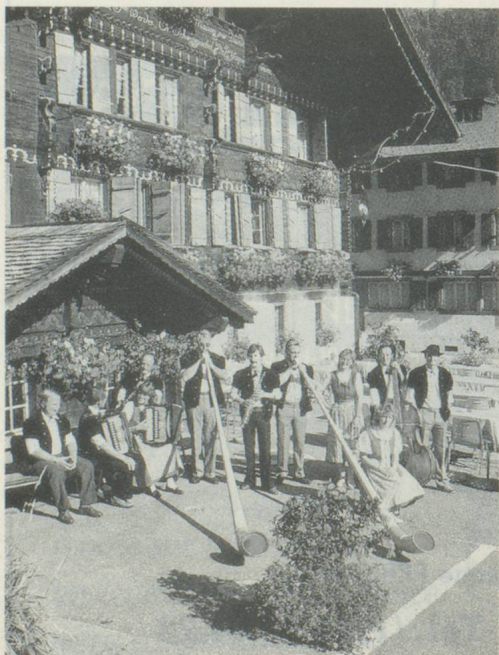
Vers-l'Eglise, l'Auberge Communale et l'hôtel de l'Ours avec, ce jour-là, un orchestre de la région.

Le premier chapitre présente d'abord la grande variété des paysages de la commune, son micro-climat particulièrement favorable et l'attrait en toute saison.