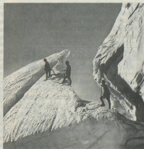
Sur le glacier des Diablerets.

En dehors de Paris, adresser les demandes à la librairie Brentano's