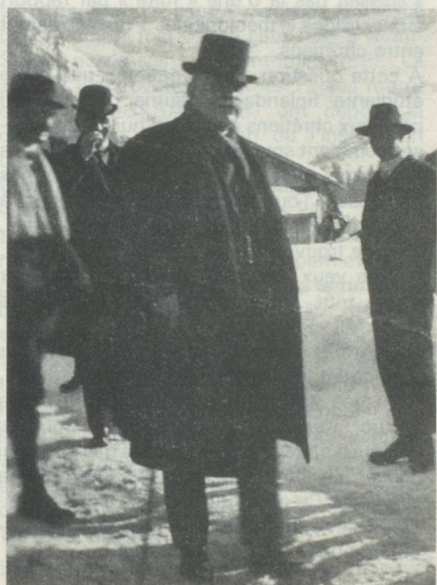
Le Maréchal Joffre aux Diablerets.