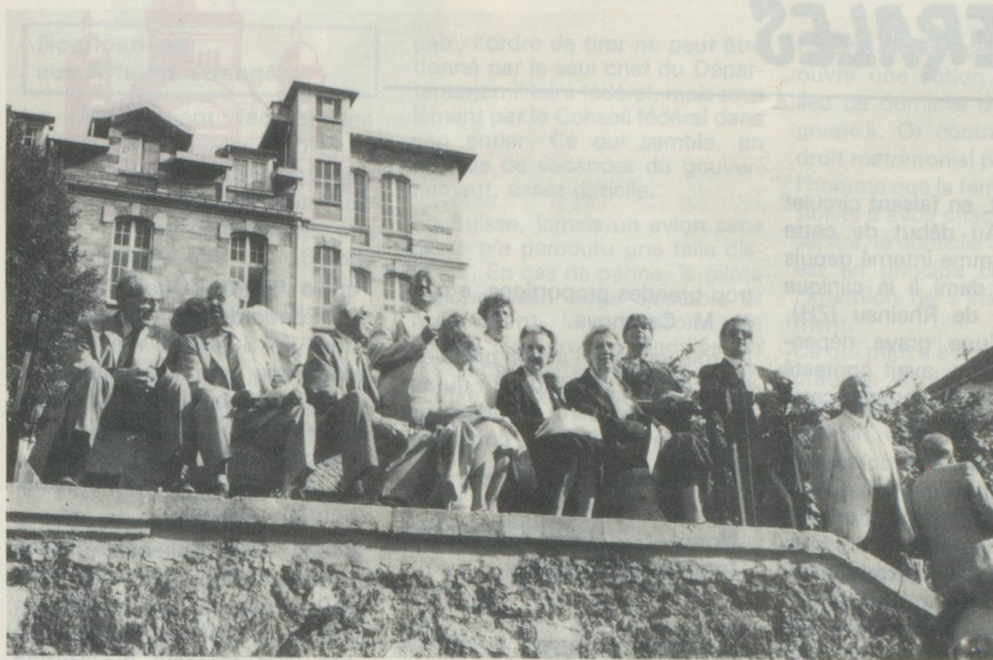
De nombreux amis étaient venus participer à cette fête !

cet instant particulier pour retracer succinctement l'histoire du Pacte Fédéral des Confédérés.