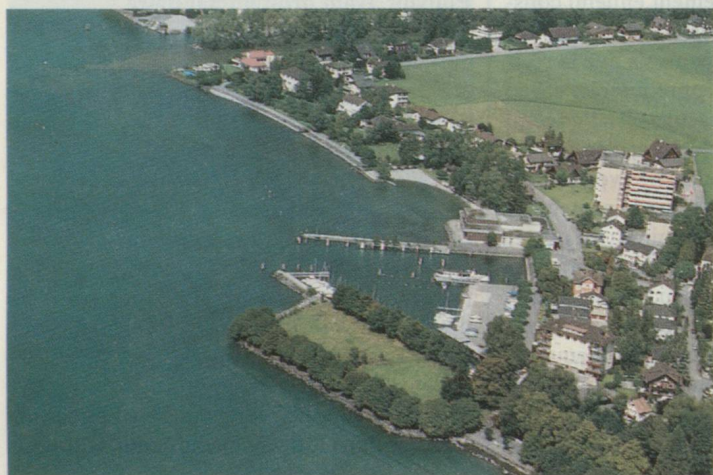
Des architectes suisses de l'étranger seront chargés de l'aménagement de cette presque île située dans la baie de Brunnen.