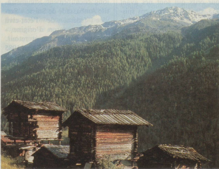
Val d'Anniviers.