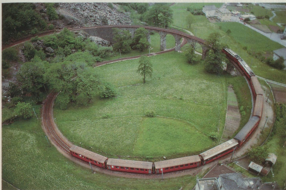
Viaduc en forme de cercle pour franchir la rampe située près de Brusio, dans le Val Poschiavo.

Le 9 octobre 1889, le convoi inaugural traversait le Prättigau sur la ligne Landquart-Davos, la première des chemins de fer des Grisons, qui s'appellent aujourd'hui «Chemins de fer rhétiques» (RhB). C'est actuellement la compagnie privée qui a le plus grand réseau de Suisse (375 km).