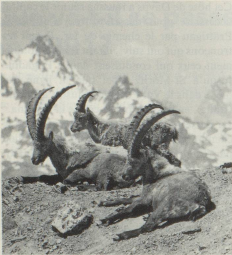
Les bouquetins lâchés en 1930 forment aujourd'hui une grande colonie.

tre comme idyllique. Mais cette image est trompeuse. Il y a cent ans, la nature perdait déjà peu à peu du terrain face à l'industrialisation et à l'accroissement de la population. En 1870 déjà, une initiative privée, celle-là, permettait la création, au pied du Creux du Van dans le Jura neuchâtelois, de la première réserve naturelle.