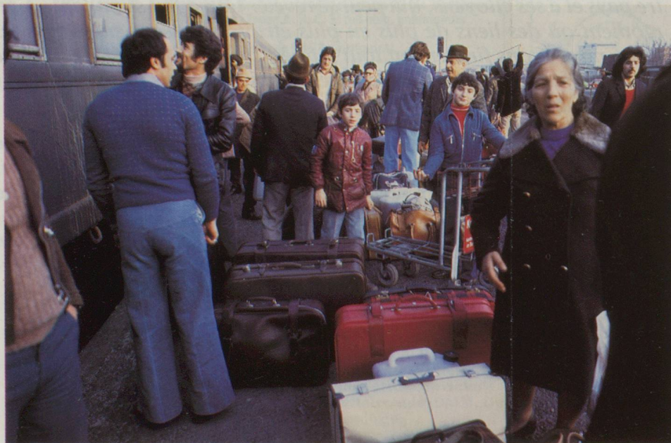
La politique d'immigration de la Suisse est en contradiction flagrante avec la libre circulation de la main-d'œuvre dans les pays de la CE.

Cela dit, il ne faut pas prendre le marché intérieur pour davantage qu'il n'est, ni mésestimer les obstacles considérables qu'il s'agira de surmonter avant qu'il ne devienne réalité. Le marché intérieur n'est fondamentalement rien d'autre qu'un espace dépourvu de barrières douanières (il l'est déjà), fiscales, administratives, techniques, et enfin physiques (plus de «douanes» aux frontières). C'est aussi, on l'oublie souvent, un