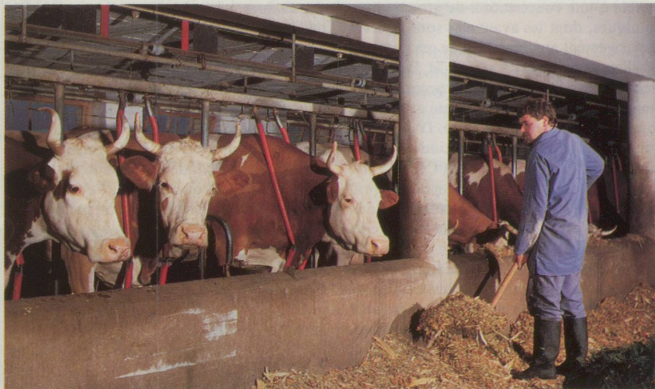
L'adhésion à la CE entraînerait une régression des domaines agricoles en Suisse.

La Déclaration dite de Luxembourg, adoptée en 1984 par les pays de la Communauté et ceux de l'AELE, et visant à créer un «espace économique européen homogène et dynamique» qui engloberait l'ensemble des pays membres des deux entités, est un peu la bouée de sauvetage à laquelle s'accroche aujourd'hui la diplomatie économique helvétique pour conjurer le mauvais sort. Sans vouloir réduire la portée de cet engagement politique, nous devons bien constater qu'il est rare que les organes de la Communauté y fassent encore allusion aujourd'hui. Manifestement, les Douze sont aujourd'hui beaucoup plus préoccupés par l'achèvement de leur marché intérieur que par le souci d'associer à l'œuvre commune des Etats tiers, certes liés à eux par d'importants flux commerciaux (la Suisse ne manque pas une occasion, par exemple, de rappeler qu'elle est le deuxième ou le troisième partenaire com-