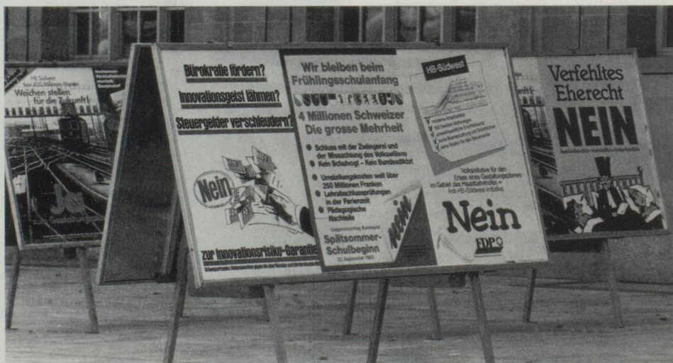
L'initiative et le référendum, droits populaires: la question de la compatibilité de nouvelles lois suisses avec celles de la CE est posée, que la Suisse adhère ou non à la CE.

Selon le Conseil fédéral, la principale question qui se pose aujourd'hui est de savoir comment la Suisse peut faire partie de cette