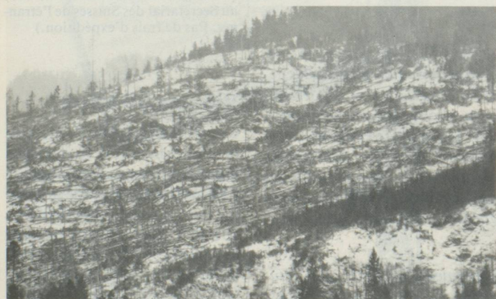
Dégâts dus à la tempête dans le canton de Glaris: des forêts de protection entières ont été dévastées.