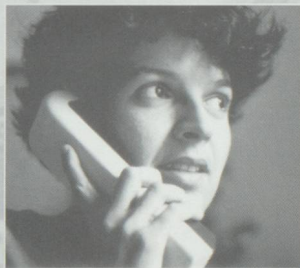
Le plaisir de téléphoner se paiera bientôt plus cher en Suisse.

Les PTT augmenteront leurs tarifs en 1992 de 4,5 à 6%. Divers tarifs postaux et téléphoniques augmenteront dès le premier février 1991 et le système à deux vitesses dans la distribution du courrier sera introduit à la même date.