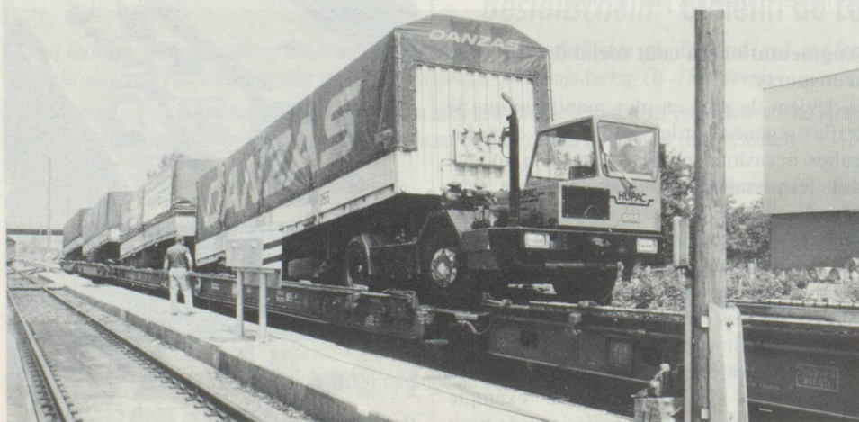
Le trafic des poids lourds dans le collimateur des critiques: le déplacement du transport des marchandises sur le rail est revendiqué pour le trafic de transit.

Cela signifie avant tout que la croissance du trafic doit connaître certaines limites; que le développement des moyens de transport doit être effectué de manière coordonnée, que les répercussions négatives du trafic doivent être réduites, que le trafic international, notamment le trafic de transit, doit être mené à