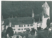
Le Château de Lucens qui est restauré et conservé par la Galerie Koller de Zürich.

Pour avoir les pieds dans l'eau : Estavayer-le-Lac. Côté cour, une enceinte de murailles et de tours, une mosaïque de monuments anciens aussi divers que séduisants : château, collégiale, musée et monastère témoignent d'un passé artis-