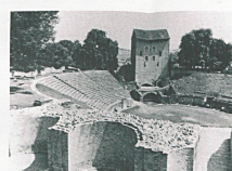
Avenches, pour les passionnés d'histoire. Une ville romaine qui s'appelait Aventicum et qui était la capitale de l'Helvétie romaine. Les témoins de cette époque sont nombreux, tel l'Amphithéâtre.

sage de la Broye et protéger la ville de Moudon, la quatrième fut au X e siècle la capitale de la Bourgogne transjurane, la cinquième, elle, fut capitale de l'Helvétie romaine. Ces cinq cités sont autant de livres d'histoire à parcourir à l'occasion d'un promenade, d'une flânerie au gré de votre caprice : Payerne