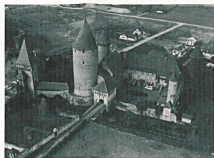
Cité historique. Estavayer-le-Lac avec son Château.