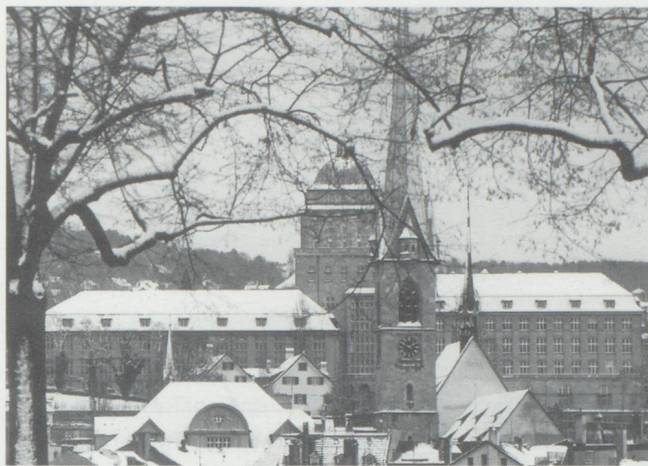
L'absence de reconnaissance mutuelle des diplômes est un exemple du manque de coordination de l'enseignement à l'échelle suisse.

■ Fiscalité : Pour la troisième fois depuis 1976, l'introduction de la taxe à valeur ajoutée est en discussion dans notre pays. Il conviendrait de faire avancer cette réforme. Premièrement, la TVA nous permettrait de nous intégrer dans le système fiscal européen. Deuxièmement, l'imposition de prestations de services apporterait une plus grande équité fiscale. Troisièmement, la taxe occulte qui décourage les investissements disparaîtrait. Quatrièmement, un premier pas important du point de vue de la compétitivité serait fait vers un changement du rapport entre impôts directs et impôts indirects en faveur de ces derniers. Un autre postulat concernant la fiscalité a trait à la suppression du droit de timbre qui renchérit pour les entreprises la mobilisation de capitaux, limite fortement les possibilités de développement de la place financière suisse, nous fait perdre des affaires bancaires lucratives surtout dans le domaine prometteur de la gérance de fortune, et mine la force innovatrice de notre pays dans le domaine financier. Enfin, des réformes s'imposent en ce qui concerne la taxation des bénéficiaires. La double imposition des bénéficiaires des sociétés (au niveau des entreprises et des actionnaires), qui a été abolie dans d'autres Etats industrialisés, constitue un désavantage concurrentiel.