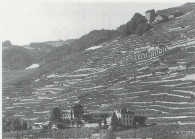
La viticulture est l'un des secteurs économiques qui bénéficient de la protection de l'Etat. (Photo : Lavaux au-dessus du Lac Léman.)

Notre démocratie directe est à tel point mise au service d'intérêts particuliers et du maintien du statu quo que l'on peut douter de son utilité pour le bien de notre pays dans son ensemble. Certes, la menace du référendum joue le rôle d'un frein, bienvenu dans de nombreux cas, mais qui peut aussi être négatif. Dans ces conditions, les grands projets ont peu de chances de se réaliser, alors qu'à l'étranger le développement des transports publics, par exemple, est rapide, des centaines d'objections entravent en