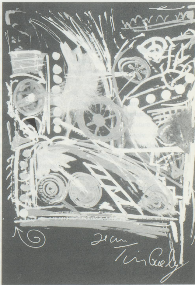
Un vrai Tinguely : le motif du 700ème.