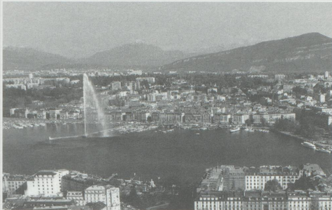
Comment réduire le déficit du budget de Genève ? Proposition de la droite qui fait parler.

supprimer des centaines d'emplois au moment où le chômage devient un réel problème à Genève. Le cartel exige donc que les négociations entre le Conseil d'Etat et le personnel de la fonction publique reprennent afin d'imaginer d'autres mesures d'économies. Face à un déficit budgétaire de 290 millions prévu pour 1992, les syndicats proposent en outre une réforme fiscale pour corriger les inégalités devant l'impôt.