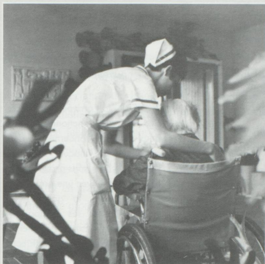
Le personnel soignant de St-Gall touché par des mesures d'économies.

Ce service s'occupe principalement d'infections post-opératoires ou de toxicomanes souffrant de plaies ouvertes. Pour le personnel soignant, il s'agit de mesures prises "sur le dos du personnel et des plus faibles".