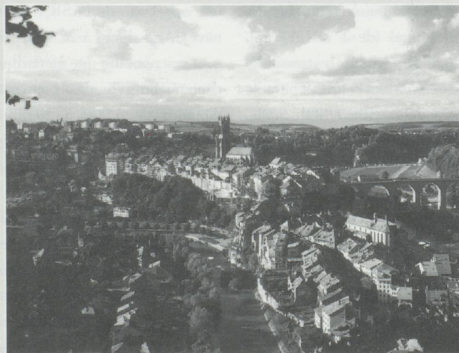
Fribourg dans le rouge en 92 ...