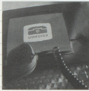
L'actualité par le service Vidéotex.

Les voyageurs suisses en déplacement ou résidant à l'étranger pourront rester en contact avec leurs proches et suivre l'actualité diffusée par l'Agence Télégraphique Suisse (ATS) via la télématique. Il leur suffira d'utiliser un ordinateur portable et une carte électronique qui les reliera au service Vidéotex du quotidien l'Express de Neuchâtel. Ainsi, le message envoyé depuis Tokyo est transmis instantanément. Il est possible de le faire parvenir à trois destinataires différents. La carte à puce, mise au point par l'entreprise COMCO sert de moyen de paiement. De fait, grâce à un terminal portable, n'importe qui pourra communiquer facilement par ce procédé, sans problème de décalage horaire. Outre cette possibilité, l'on pourra également consulter les bulletins d'information de l'ATS, transmis en trois langues, remis à jour toutes les deux heures. L'utilisateur de cette messagerie pourra aussi se rendre dans un point télématique muni de sa carte à puce pour transmettre son message. Quinze pays sont déjà équipés de points télématiques munis par ailleurs d'un clavier. Swissair, l'Express, Comco ont collaboré à ce projet, avec le soutien des PTT. ■