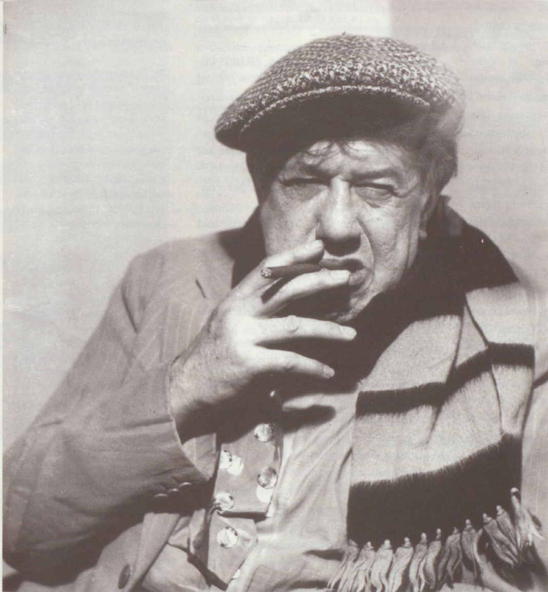
Michel Simon dans Fric-Frac au Théâtre Antoine en 1950.