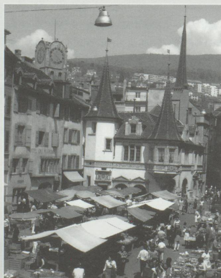
Un prix pour faire connaître Neuchâtel.

La Fondation pour le rayonnement de Neuchâtel vient d'annoncer la création d'un prix destiné à récompenser une