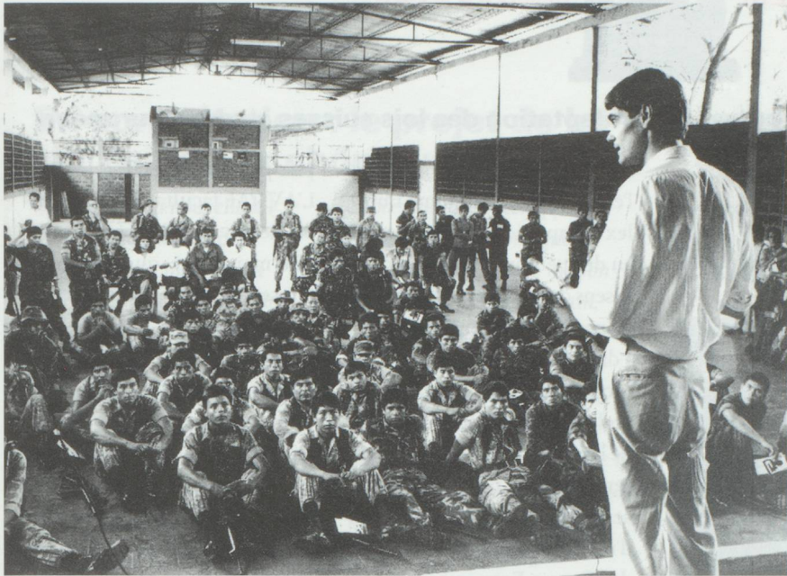
Diffusion du droit humanitaire dans une caserne au Salvador.