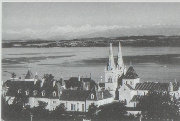
Neuchâtel : le Conseil d'Etat vient de proposer au Grand Conseil un projet de réorganisation complet de l'appareil administratif.

Définie il y a de cela un peu plus d'un siècle, la structure du gouvernement neuchâtelois commençait à prendre quelques rides. Soucieux d'une meilleure adaptation aux besoins d'aujourd'hui et d'une plus grande efficacité, le Conseil d'Etat vient de proposer au Grand Conseil un projet de réorganisation complet de l'appareil administratif. De dix départements (agriculture, police, cultes, instruction publique, justice, finances, économie, intérieur, travaux publics et militaire), on passerait à cinq. Le but étant de rationaliser et d'éviter que les secteurs importants (principalement les affaires sociales, la santé et l'environnement) ne dépendent de plusieurs départements sans que l'on sache forcément à qui sont dévolues les compétences.