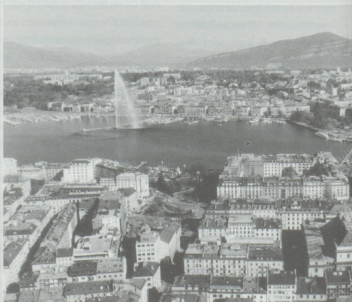
Genève. La ville a décidé de se donner une nouvelle chance pour relancer le tourisme.