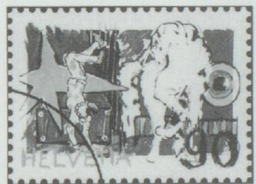
90 cts. : Arlequin avec lippizan.