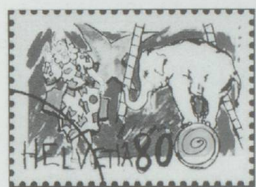
80 cts. : clowns blancs avec éléphant.