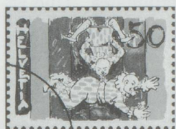
50 cts. : clowns au trapèze.