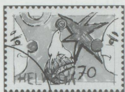
70 cts. : Auguste avec otarie.