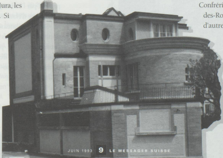
La Chaux-de-Fonds : villa réalisée par Le Corbusier.