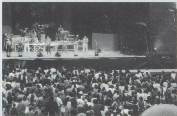
L'atmosphère incomparable du Paléo-Festival de Nyon.