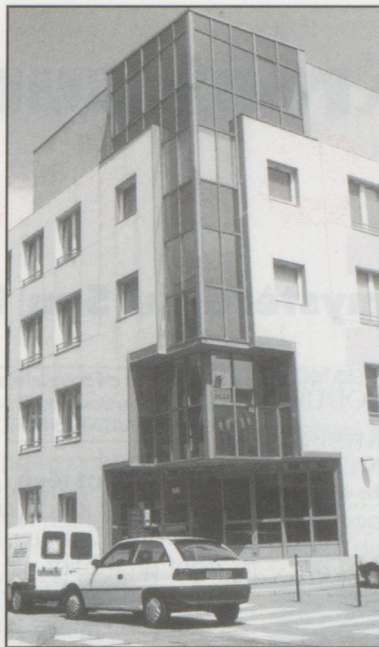
Le 16, rue Pierre Brossolette