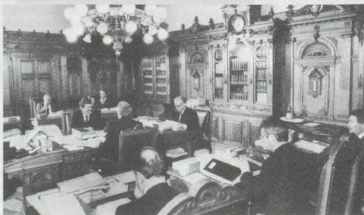
Une séance du Conseil fédéral

Le nombre de chômeurs inscrits a diminué de 1,6% au mois de septembre, pour s'établir à 143 458 personnes, ce qui porte le taux de chômage national à 4%. Tous les cantons romands ont enregistré une baisse du taux de chômage, à l'exception de Genève, où le nombre de sans-emploi est resté stable. Après les stagnations des mois de juillet et août, ce recul était attendu par l'Office fédéral de l'industrie, des arts et métiers et du travail (OFIAMT). Toutefois, l'Office s'attend à une nouvelle hausse d'ici à la fin de l'année, avec un taux de chômage proche de 4,2%. Cette progression serait essentiellement due à des facteurs saisonniers.