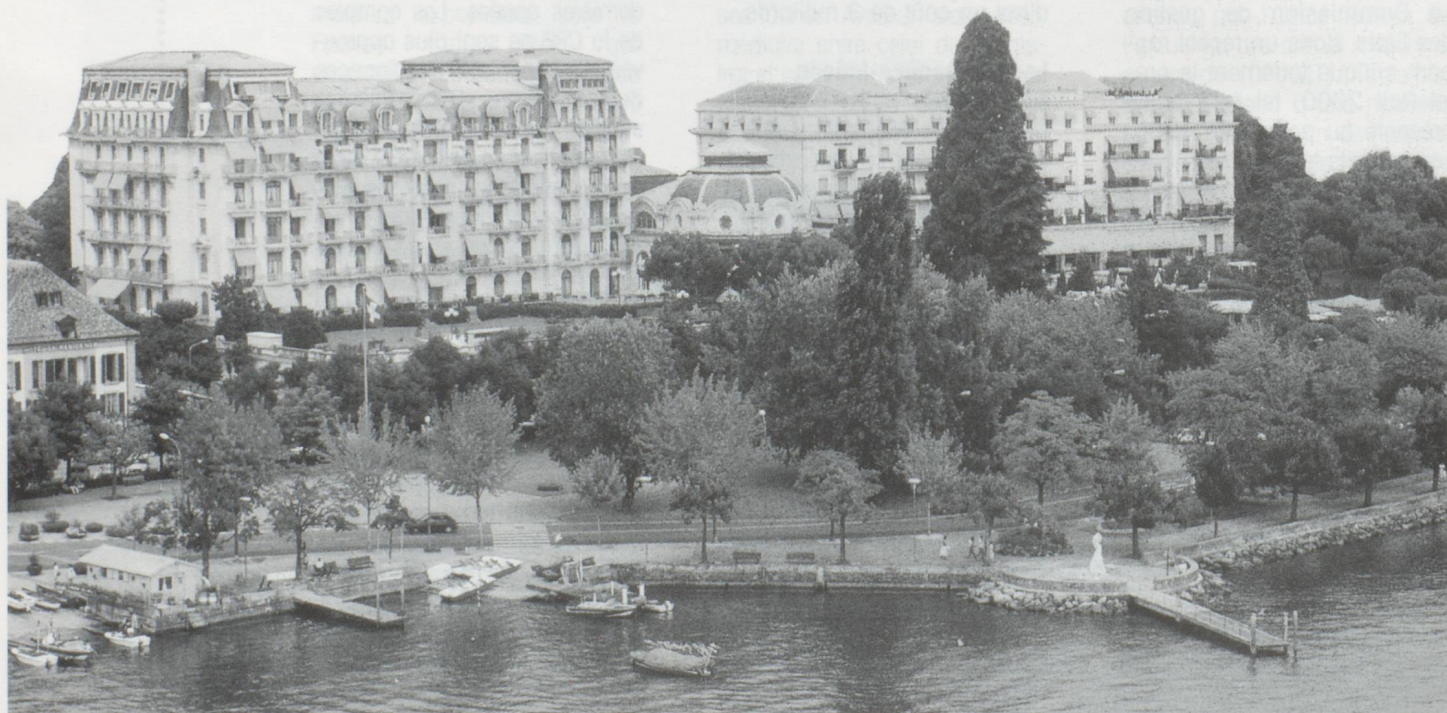
Une vue de Cornélia, Suisse

En remportant son match face à la Hongrie (3-0), l'équipe de football suisse s'est qualifiée pour l'Euro 96. Ce sera la première participation des Suisses à un Championnat d'Europe des nations. Le football suisse peut aujourd'hui oublier ses complexes et dribbler la tête haute. Cette belle assurance, Sforza et ses coéquipiers la doivent avant tout à leur entraîneur, Roy Hodgson. Arrivé en Suisse en 1990, il avait amené l'équipe nationale en Coupe du Monde, quatre ans plus tard. Ce brillant parcours n'a pas manqué de susciter l'intérêt d'autres clubs, aux arguments plus convaincants - financièrement - que ceux de l'équipe nationale suisse. L'entraîneur anglais a donc succombé aux sirènes de l'Inter de Milan, où il officiera la saison prochaine. Espérons que les footballeurs suisses sauront vivre - et marquer ! - sans leur Pygmalion.