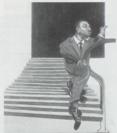
Francis Bacon est exposé au Musée des Beaux-Arts de Lausanne

Antonio Girbes, photographies. Jusqu'au 30 janvier, du mardi au vendredi de 15h à 19h, le samedi de 10h à 12h et de 15h à 19h.