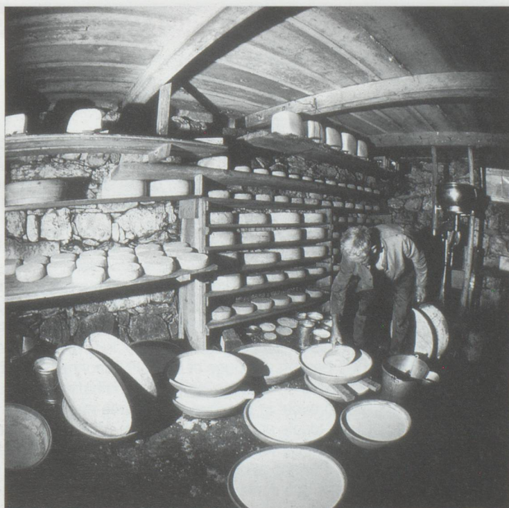
L'économie laitière absorbe une large part des subventions fédérales

L'armée suisse renonce complètement à posséder et utiliser des mines antipersonnel. Cette