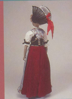
Appenzell Rhodes intérieures. Costume des grands jours, laisse voir la chemise (Barärmel).