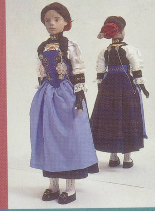
Nidwald. Le costume de paysan traditionnel avec des broderies.