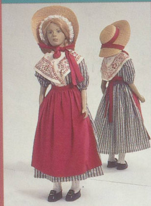
Genève. Costume du dimanche de la ville de Genève.