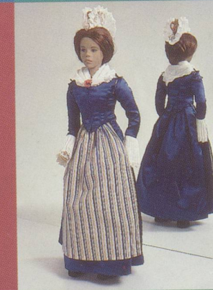
Schwyz. Costume de fête des bourgeois avec coiffe blanche.