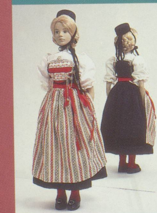
Schaffhouse. Costume de jeune fille avec la coiffe Biremassli.