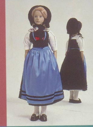
Zurich. Le costume de fête du Wehntal.