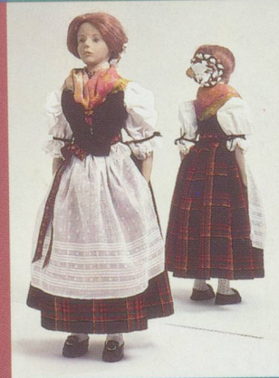
Obwald. Costume de fête avec fichu de Milan.