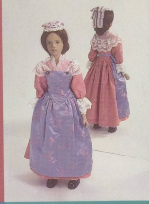
Fribourg-Ville. Costume de bourgeoise de la ville de Fribourg avec un chapeau-liron.