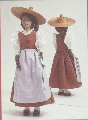
Vaud. La robe du dimanche avec chapeau de paille à cheminée.