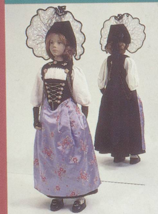
Berne. Costume noir bernois, parure d'argent, coiffe en dentelle de crin.