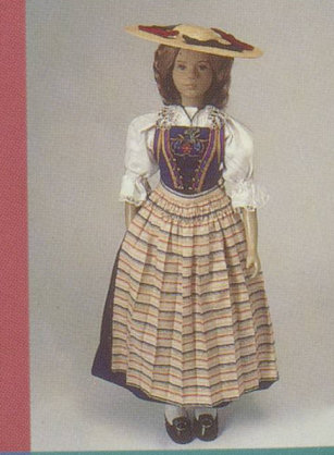
Lucerne. Costume du dimanche, chapeau de paille à noeud de velours.

Petit clin d'œil folklorique, les poupées réalisées par Claire Wettstein sont habillées de robes traditionnelles des 26 cantons suisses. Nous débutons la série aujourd'hui. Rendez-vous dans nos prochaines éditions pour découvrir les beaux atours des régions suisses.