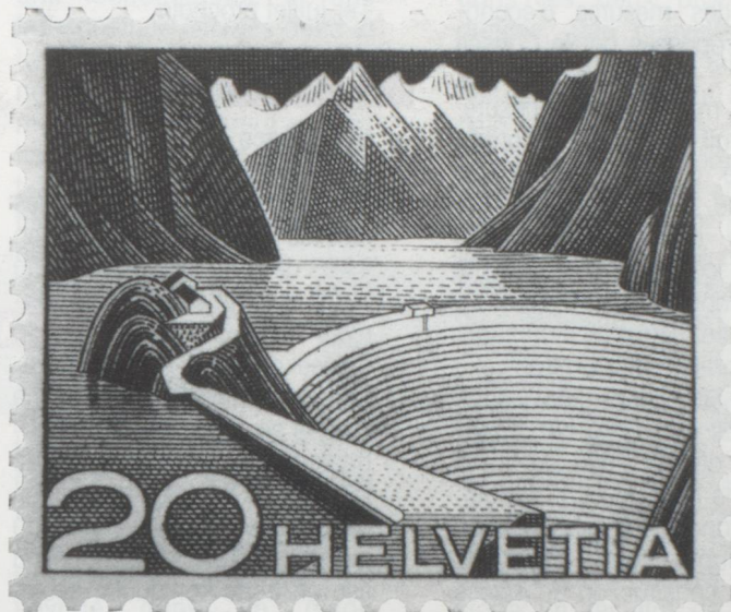
Grand lac artificiel du Grimsel, crêtes du Finsteraarhorn.

Le premier parcours totalise 105 km, et présente 3 049 m de