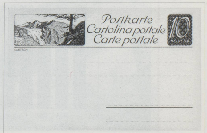
Gletsch, glacier du Rhône et le Galenstock